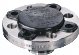
300 lbs. Serie